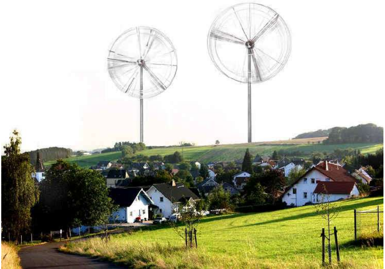
Fotomontage (Anlage 3 a) Blick über Alsbach