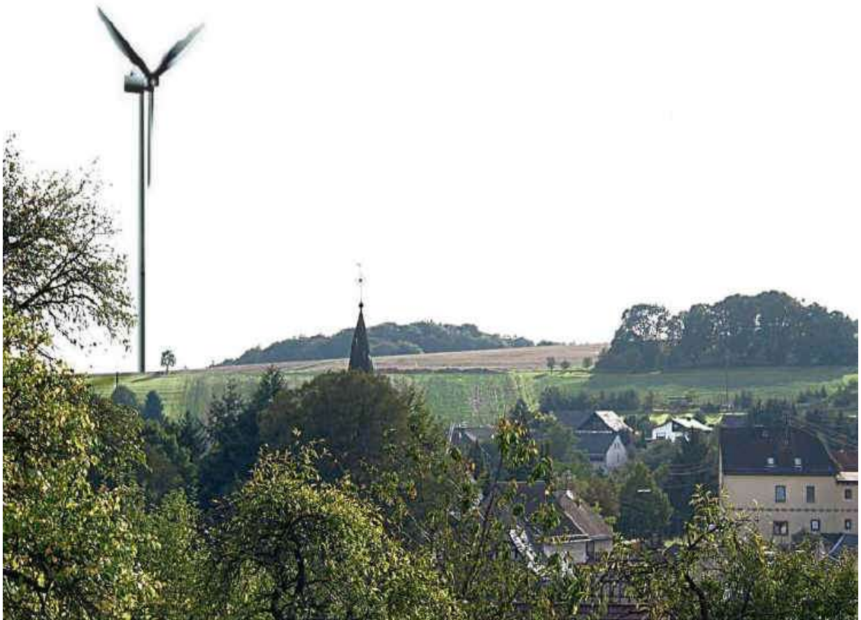
Fotomontage (Anlage 3 b) Blick über Alsbach